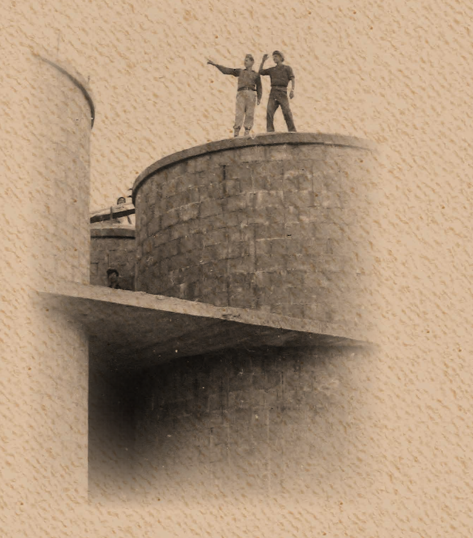
מלאו אסמינו בר