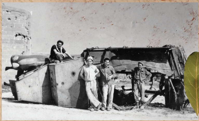
האוטו שלנו עלה על מוקש - ואנו ממשיכים עם מה שיש