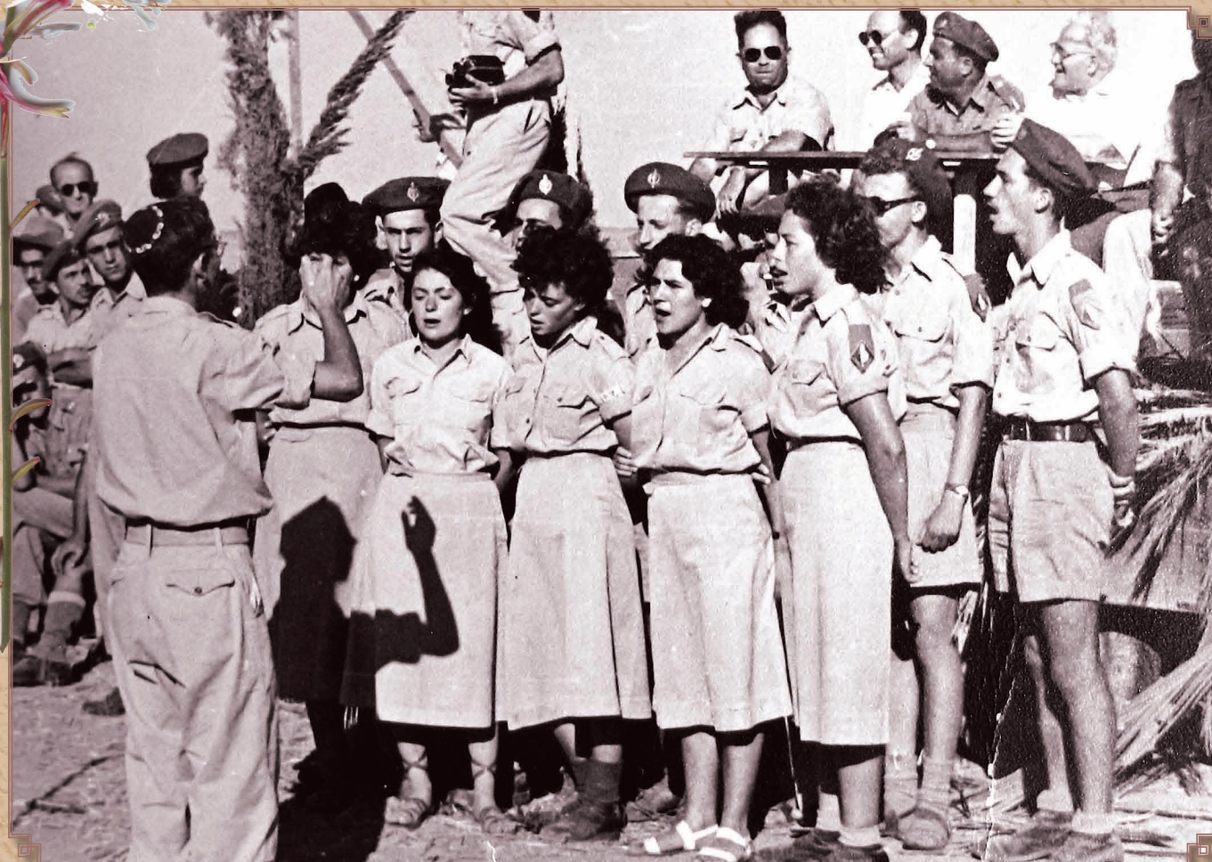
לורו, הביטו וראו מקפאת גרמין צ' ביום הצליפה אנוח - 1947