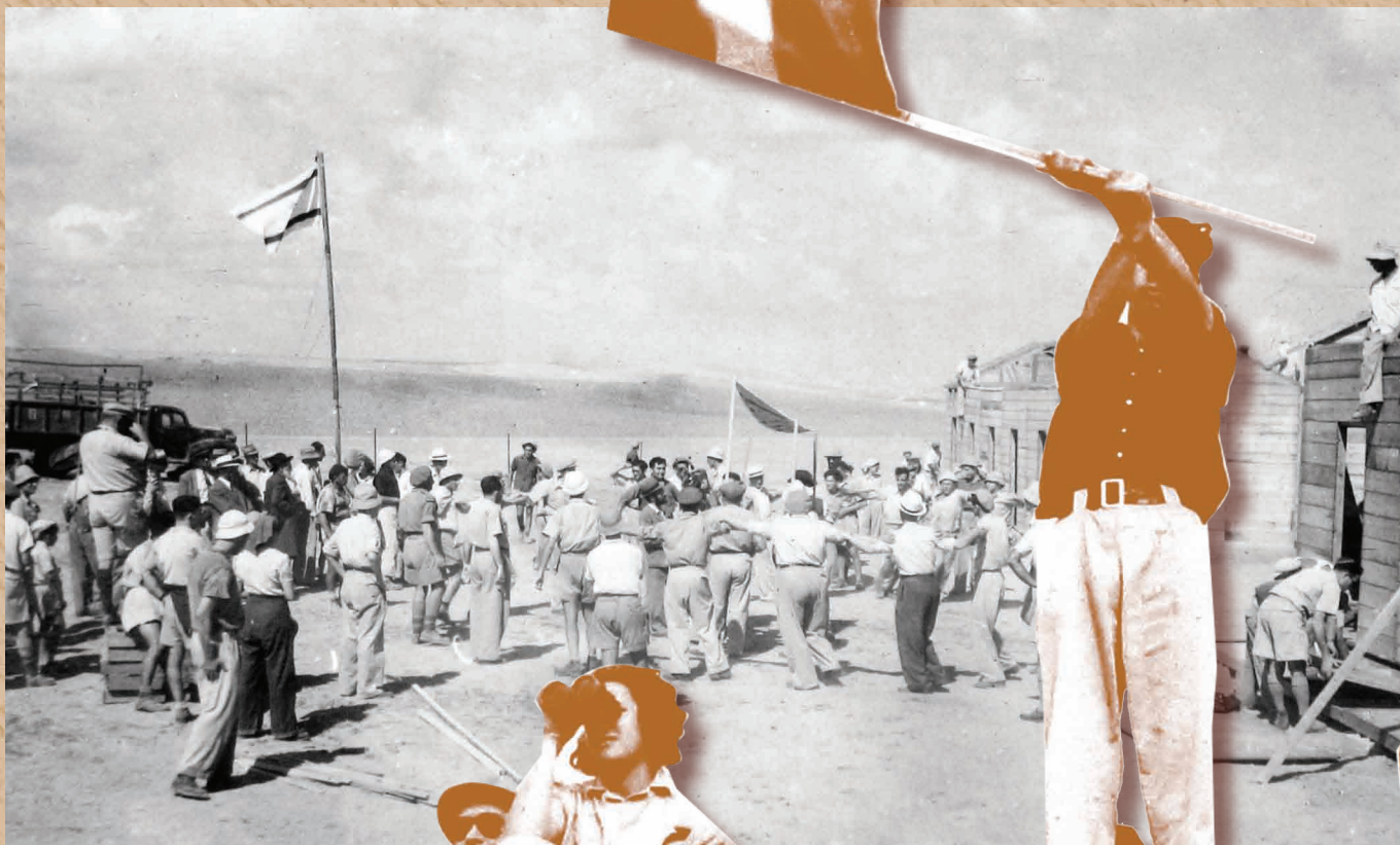
הקשר האלחוטני הראשון בשפת הדגלים