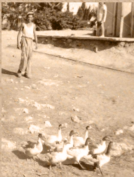
הלול הראשון בצעדי ברוז