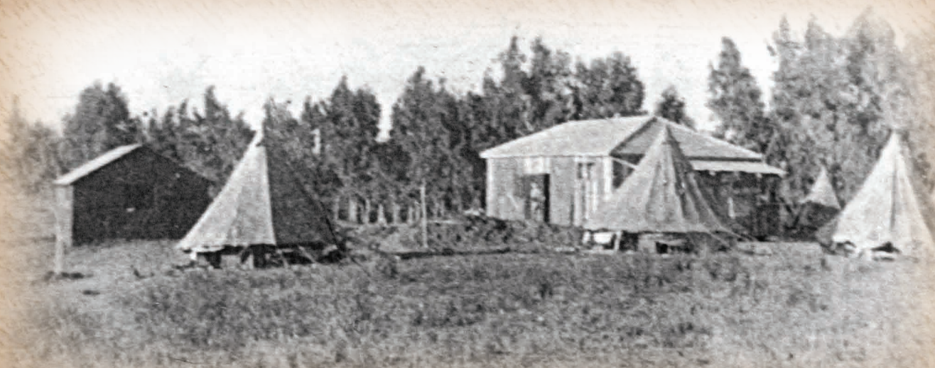
"בתי המלון" של הקבוצה

קבוצת צעירים, חברי בני - עקיבא, אשר עברו הכשרה בטירת - צבי וכנפר גדעון, חברו אל צעירים שעשו הכשרתם בנס - ציונה ועלו להתיישבות על חולות העיר נתניה, להגשים חלום: הקמת קבוצת בני - עקיבא הראשונה "עלומים"