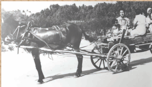
עגלת הילדים הראשונה